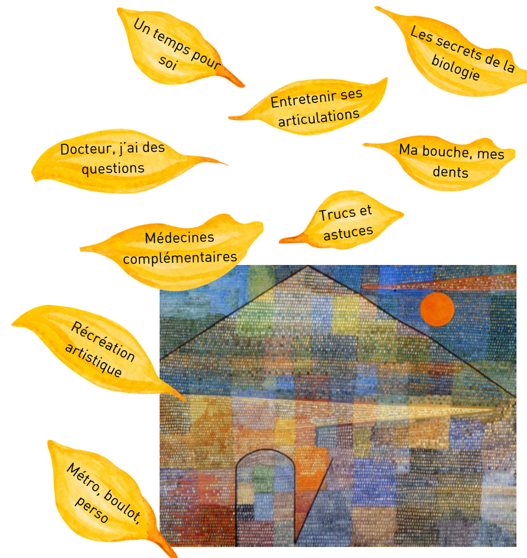
Paul Klee 1879-1940