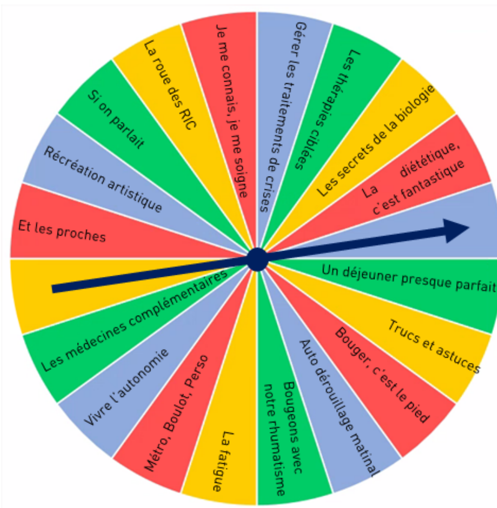
La roue des RIC ...