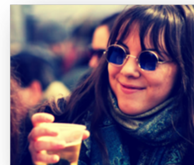
L'alcool, le tabac