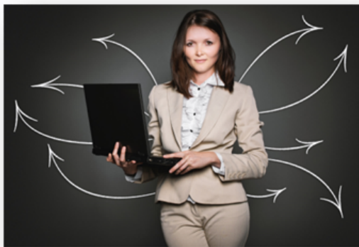
Mon orientation professionnelle