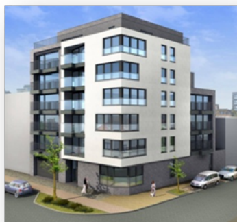
Mes projets, les assurances